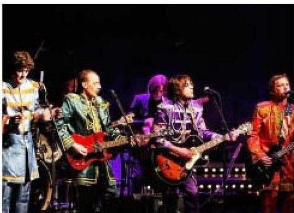
STILLER TROLIG: The Bjorvands